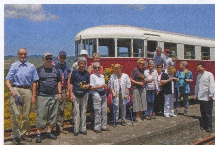
Antike Bahn: Die Ferrovia circumetnea.