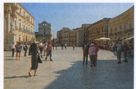
Kultur pur: Der Domplatz von Syrakus.