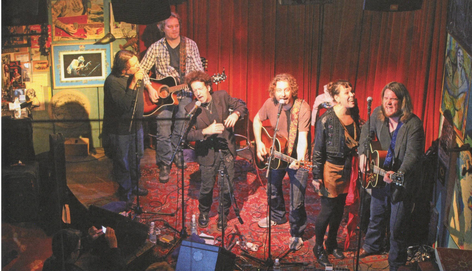
Am 4. Dezember gastiert die Light-of-Day-Tournee zum vierten Mal in Zürich. Sichern Sie sich rechtzeitig Ihr Ticket!