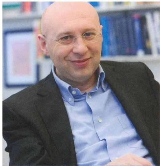
Le Prof. Stefan Hell, inventeur du révolutionnaire microscope STED.