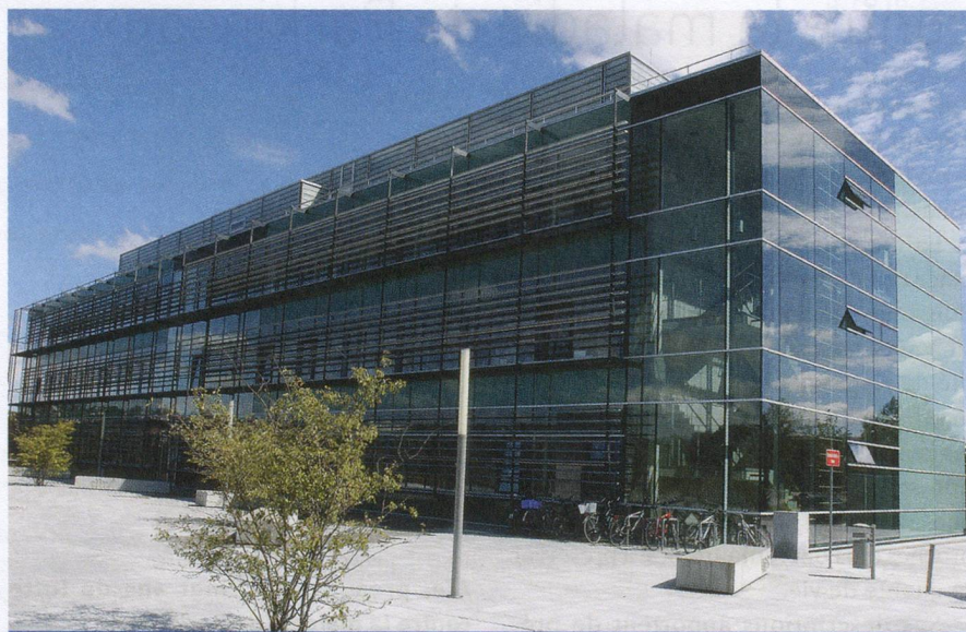
Au premier plan de la recherche sur le Parkinson : le laboratoire de l'Institut Hertie de recherche clinique sur le cerveau à Tübingen, fondé en 2004.