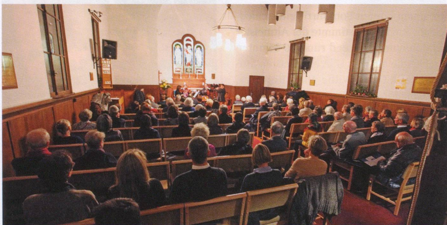
Tolle Kulisse: Mit knapp 100 Besucherinnen und Besuchern war die St. Ursula's Church zu Bern beim Benefizkonzert fast zur Gänze gefüllt.