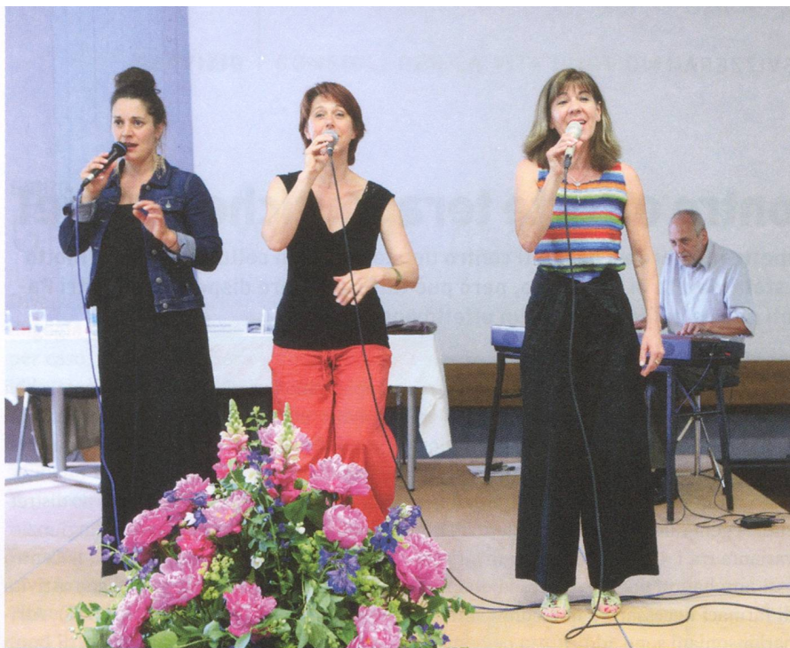
Il gruppo basilese delle Ladybirds ha assicurato l'intrattenimento musicale.