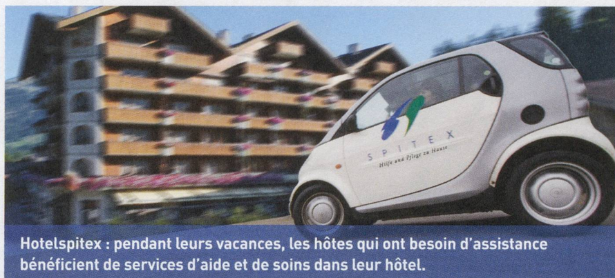
Hotelspitex : pendant leurs vacances, les hôtes qui ont besoin d'assistance bénéficient de services d'aide et de soins dans leur hôtel.