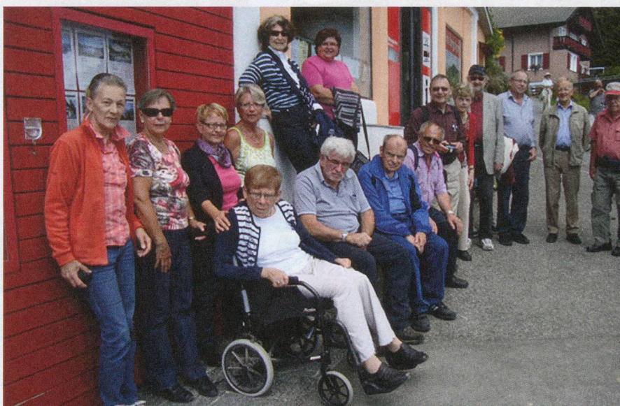
SHG Pilatus und Angehörigen-SHG Luzern: Mit 21 Personen auf die Rigi.