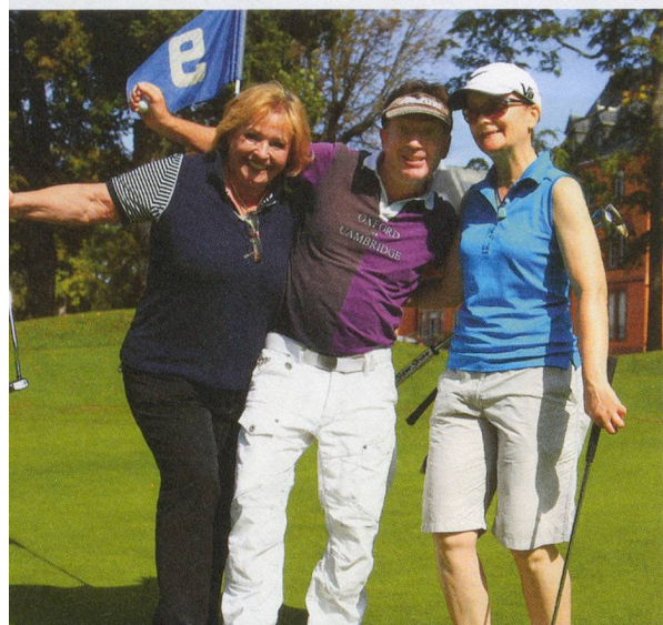
Nicht nur dieses Team in Hombourg war ...