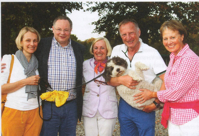
... von der Arbeit des OK der Golf trophy «Art et Château» 2014 begeistert.