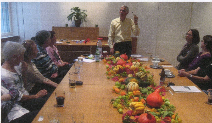
Angehörigen-SHG Basel: Viel Wissenswertes über Hilfsmittel erfahren.