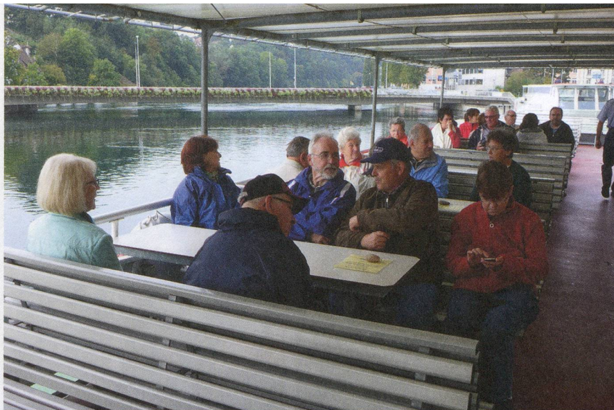
SHG Schaffhausen: Jubiläums-Ausflug mit Schifffahrt auf dem Rhein.