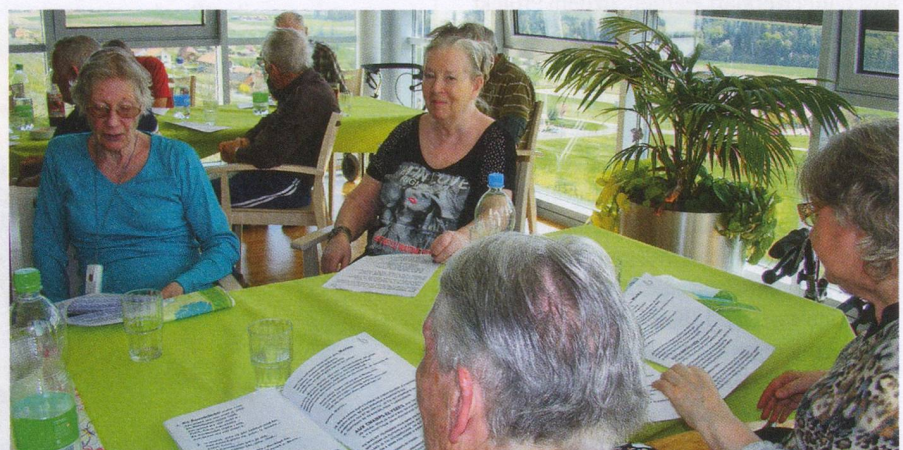
Welt-Parkinson-Tag in der KLINIK BETHESDA: Kuchen, Gesang und gute Laune!

lungsleiter Aktivierungstherapie, zur Gitarre und es wurde gesungen, gelacht und geredet. So entstand eine schöne kleine Feier, die – obwohl von Parkinson ausgehend – für alle Anwesenden eine willkommene Abwechslung im Klinikalltag brachte. jro