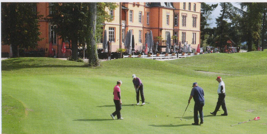
Die 4. Golftrophy «Art et Château» findet am 28.9.2014 statt – jetzt anmelden!

Machen auch Sie bei der Golftrophy mit! Anmeldungen sind bis 31. August 2014 möglich bei der Geschäftsstelle in Egg, Tel. 043 277 20 77, Fax 043 277 20 78, E-Mail: info@parkinson.ch .