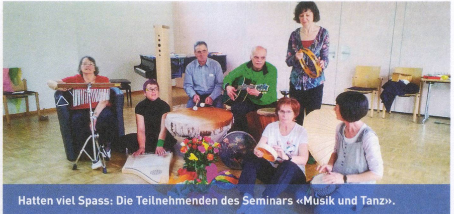
Hatten viel Spass: Die Teilnehmenden des Seminars «Musik und Tanz».