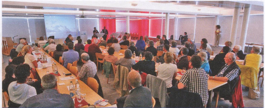
Das 3. Parkinson-Gipfeltreffen 2014 auf dem Säntis war ein toller Erfolg.