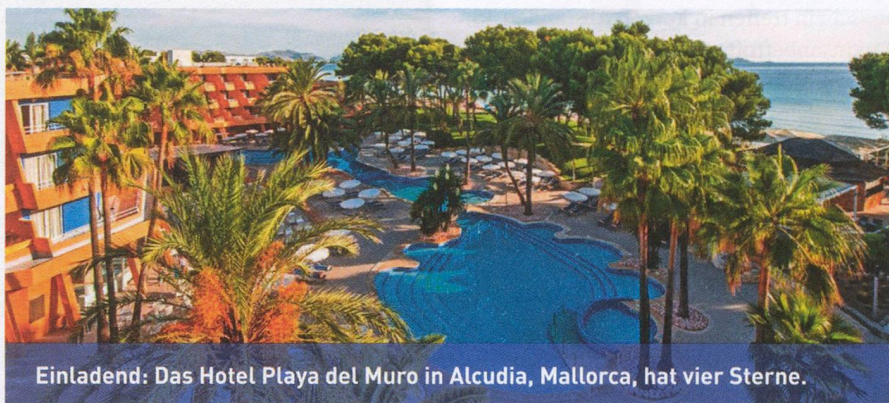
Einladend: Das Hotel Playa del Muro in Alcudia, Mallorca, hat vier Sterne.

Die Reise, die von der Mawi Reisen AG in Frauenfeld durchgeführt wird, richtet sich an alle, die das Fernweh spüren und aktiv neue Energie tanken möchten. Sie werden – unter Palmen, in entspannter Atmosphäre und unter fachkundiger Anleitung – bei Bewegungsübungen an Land und im Wasser neue Erfahrungen für ein positives Körpergefühl sammeln. Zudem werden auf Wunsch auch lockeres Walking, Atemtherapie oder leichte Gymnastik angeboten, wobei das Programm individuell auf die Teilnehmer abgestimmt wird. Und natürlich wird es auch Ausflüge geben!