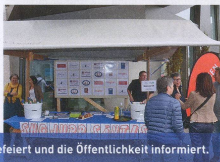
JUPP Säntis: Zum 10-Jahre-Jubiläum gefeiert und die Öffentlichkeit informiert.