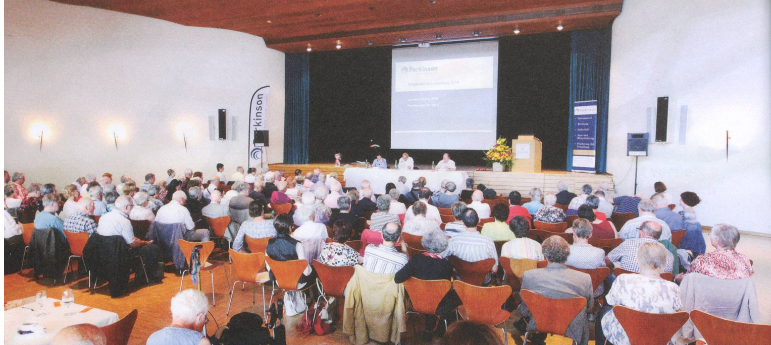
Der Hitze getrotzt: 112 stimmberechtigte Mitglieder und 57 Gäste reisten zur Mitgliederversammlung nach Winterthur.