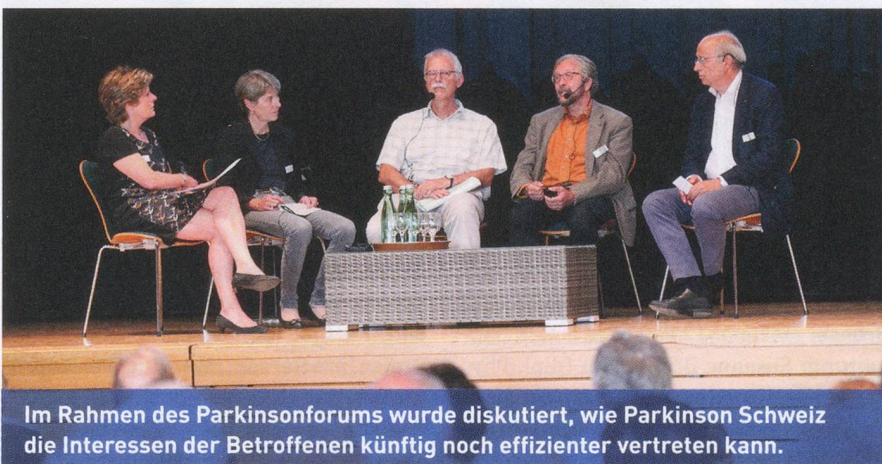
Im Rahmen des Parkinsonforums wurde diskutiert, wie Parkinson Schweiz die Interessen der Betroffenen künftig noch effizienter vertreten kann.

Der Tradition folgend verlegt Parkinson Schweiz die MV 2016 erneut. Die 31. MV der Vereinigung wird am Samstag, 11. Juni 2016 in Fribourg stattfinden. jro