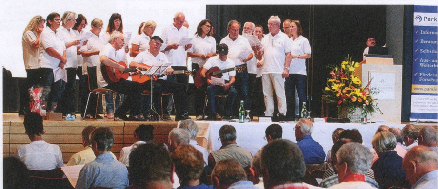
Musikalische Einlage: Die Sängerinnen und Sänger der JUPP Säntis und der Singgruppe Lustenau sorgten für gute Stimmung im Saal.