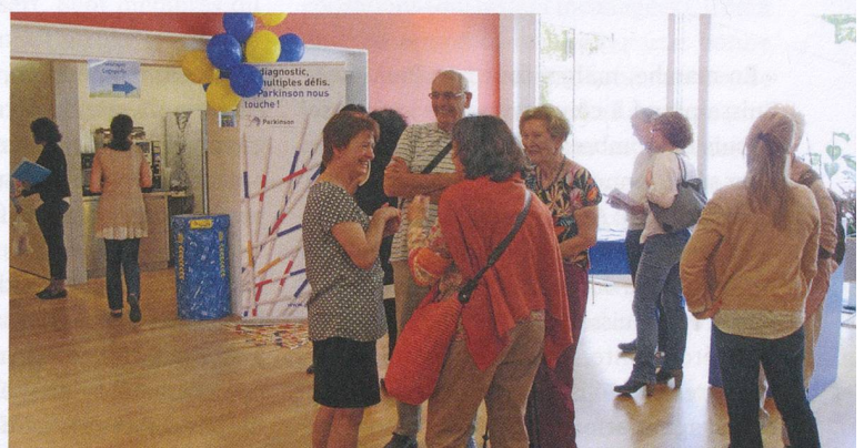
À Lausanne, l'association était présente lors de la journée portes ouvertes du Site de Plein Soleil organisée le 22 mai.