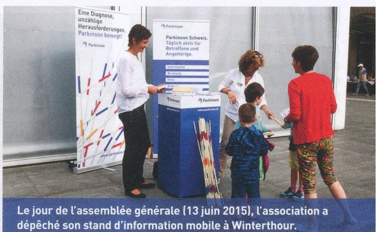
Le jour de l'assemblée générale (13 juin 2015), l'association a dépêché son stand d'information mobile à Winterthour.