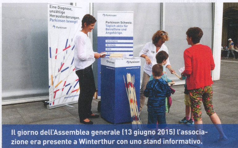
Il giorno dell'Assemblea generale (13 giugno 2015) l'associazione era presente a Winterthur con uno stand informativo.