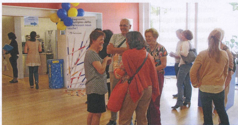
A Losanna l'associazione si è presentata al pubblico il 22 maggio, in occasione delle porte aperte del Site de Plein Soleil.