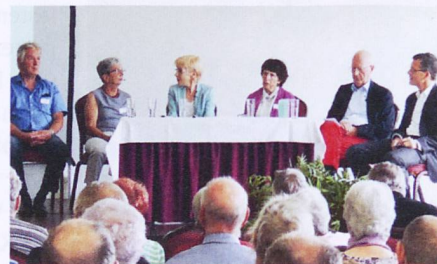
Mobilität war Thema auf dem Podium.