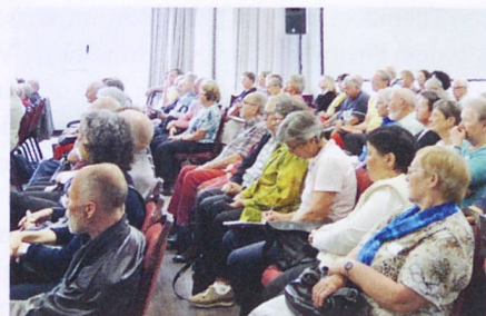
Das Publikum beteiligte sich mit Fragen.