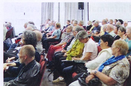
L'audience a fait preuve de curiosité.