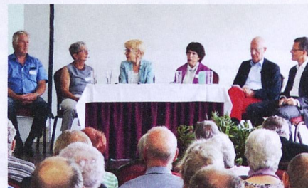
La mobilité était sur toutes les lèvres.