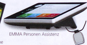
EMMA Personen Assistenz