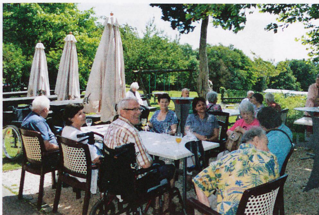
Le groupe d'entraide de Neuchâtel a fêté son trentenaire à la Rouvraie au-dessus de Bevaix.

30 ans : groupes de Zoug, Neuchâtel et Lausanne