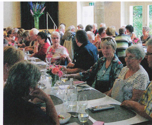
Nella sala c'era un bell'ambiente, e molti hanno sfruttato le pause per fare due chiacchiere.

Dopo un pranzo delizioso e l'esibizione del giovane cantautore grigionese Mattiu Defuns, gli aventi diritto di voto hanno rieletto all'unanimità l'intero Comitato per un altro mandato di due anni. I membri hanno inoltre accolto la proposta del Comitato