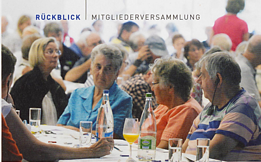
Die Mitgliederversammlung 2018 zum Thema Angehörige lockte ein grosses Publikum nach Luzern.