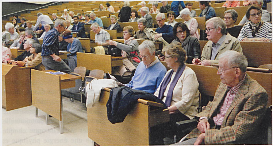
L'auditoire César Roux au CHUV à Lausanne a fait le plein d'intéressés le 17 mai.