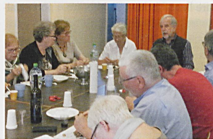
Un momento di aggregazione.

Chi ci parla del suo gruppo di auto-aiuto?