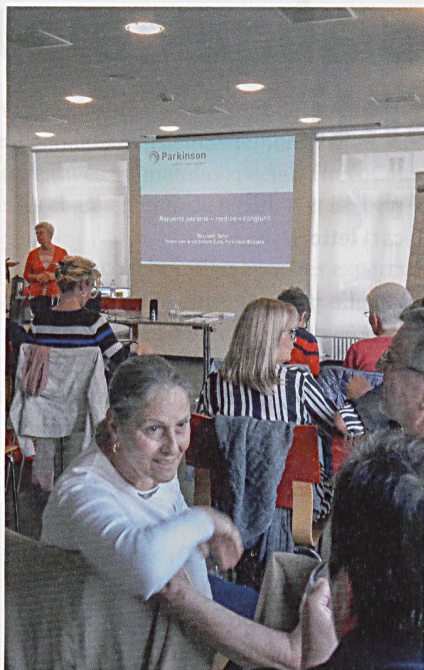
Momenti di scambio costruttivi tra i partecipanti al seminario del 10 ottobre.