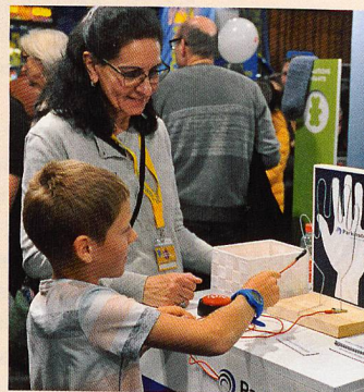
Jeu d'adresse au salon Planète Santé 2019.

Cette année, grâce à la présence active et soutenue des responsables des groupes d'entraide du Valais, les personnes intéressées ont pu rencontrer des parkinsonien(ne)s et des membres de leur entourage, discuter avec elles / eux et leur poser des questions directement. André Dembinski