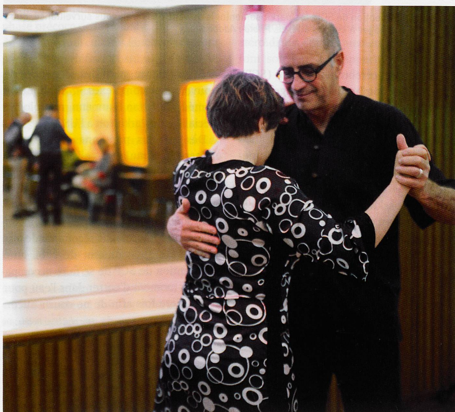
Le tango développe l'équilibre et met de bonne humeur.

Sources : InFo Neurologie & Psychiatrie du 31.8.2019 ; Romenets, Silvia Rios, et al. Tango for treatment of motor and non-motor manifestations in Parkinson's disease: a randomized control study. Complementary Therapies in Medicine, vol. 23.2, 2015, pp. 175-184