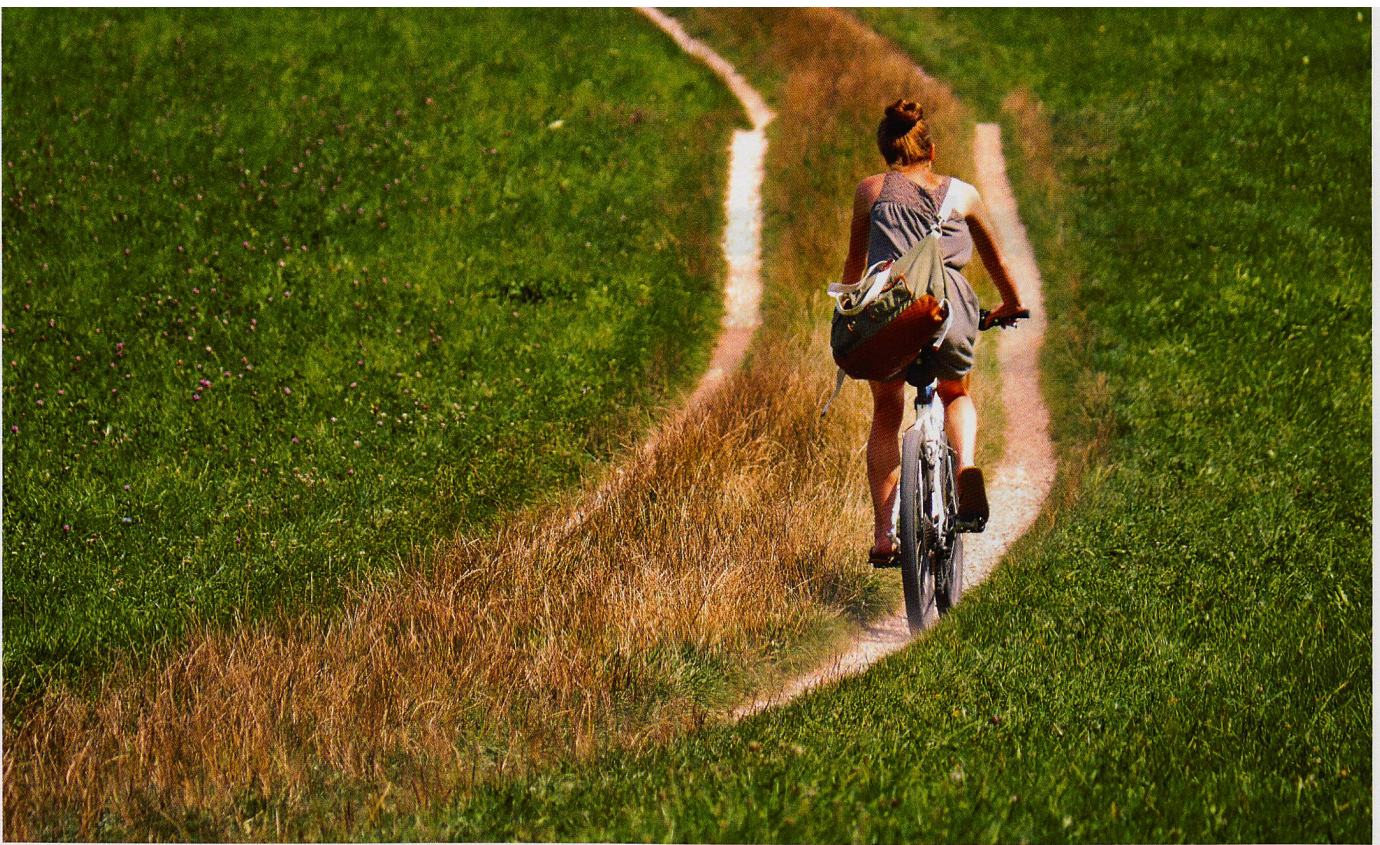
Velofahren kann mässig bis intensiv ausgeübt werden.