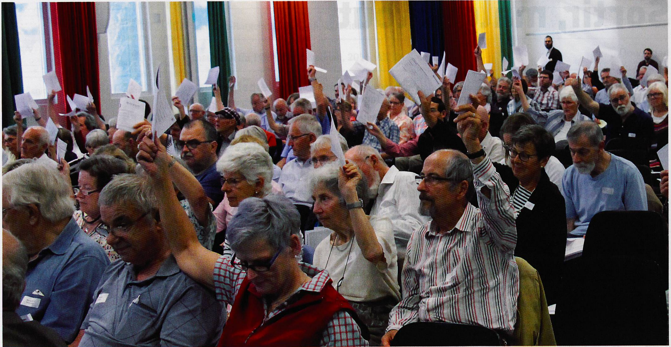
Assemblée générale 2019. En 2020, une telle proximité était inconcevable. Le vote a eu lieu par correspondance.