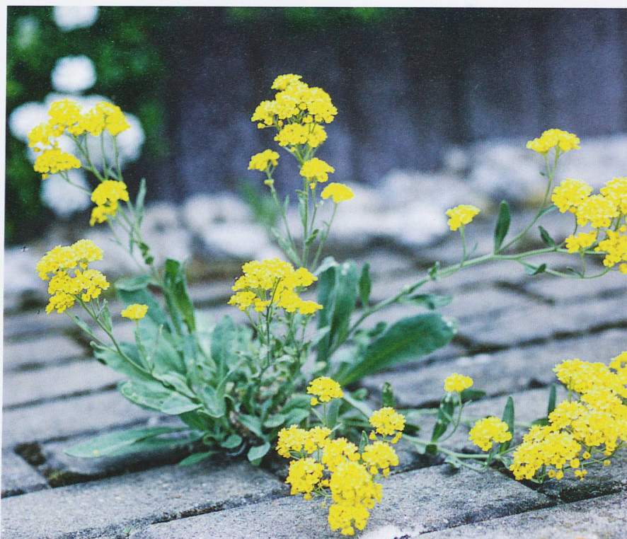
Faire preuve de résilience, quels que soient les défis.