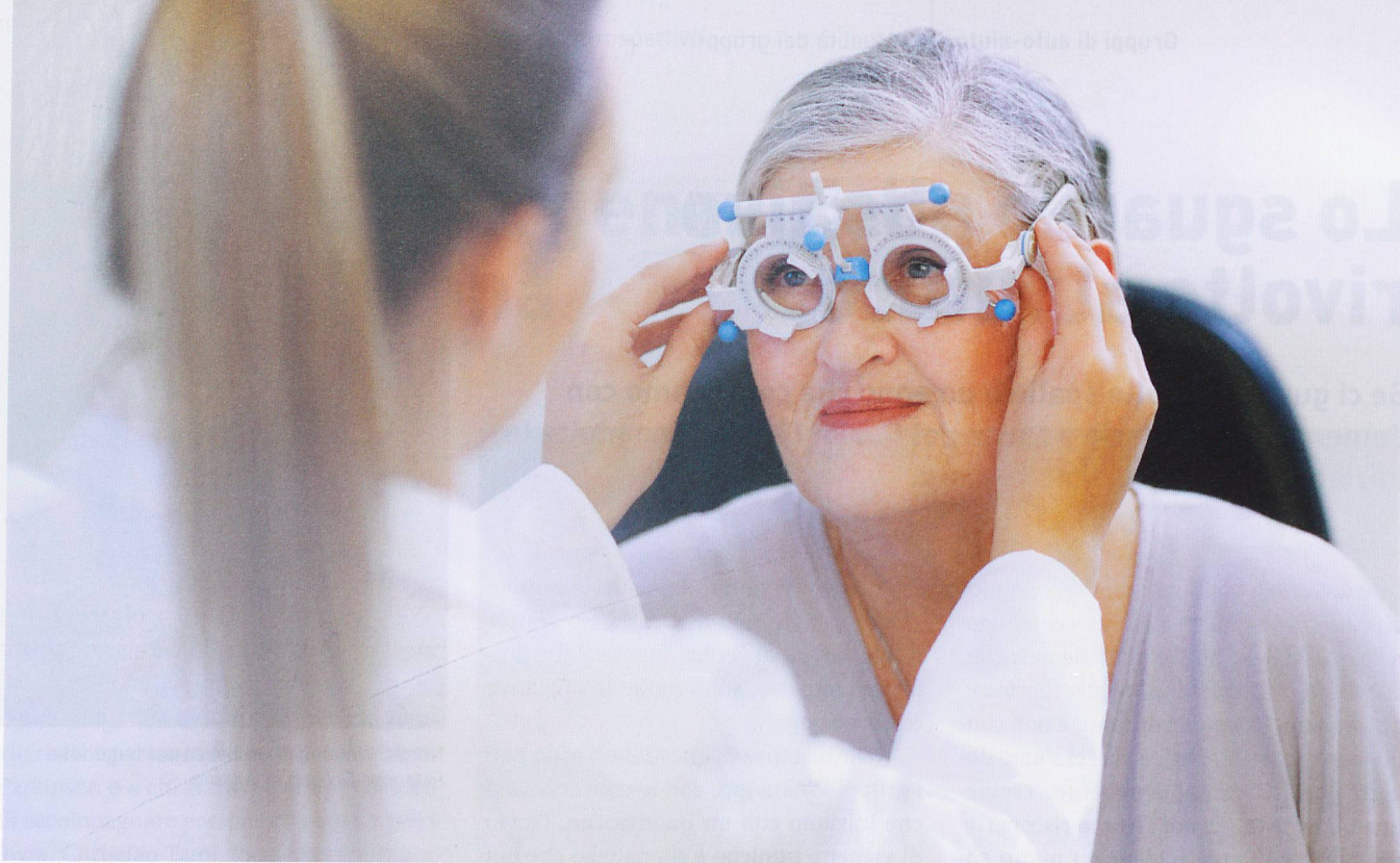
Una parkinsoniana: «A volte vedo doppio.»