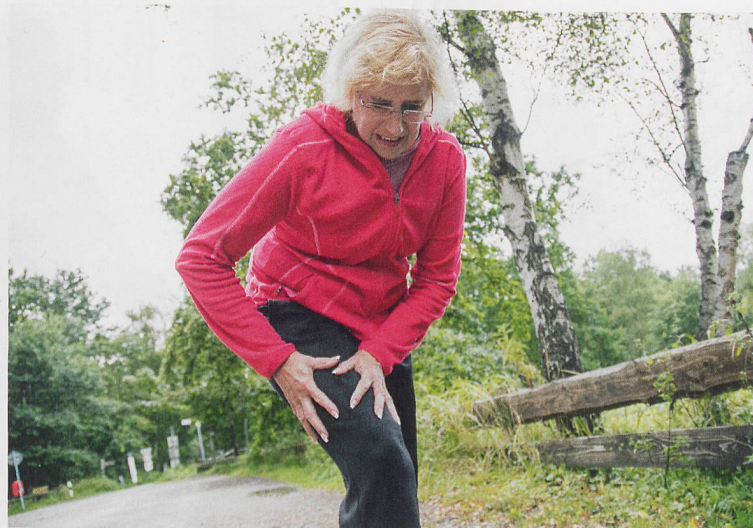
Au fil de l'évolution, la proportion des personnes concernées souffrant de douleurs peut atteindre 80 %.

2019, Parkinson Suisse CHF 9.- pour les membres CHF 14.- pour les non-membres