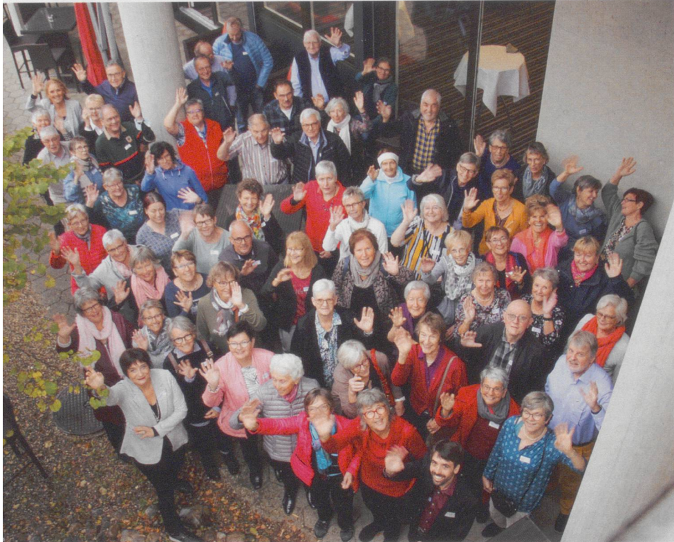
Die Leitungsteams gingen der Frage nach, wie das Wissen um Resilienz in Selbsthilfegruppen umgesetzt werden kann.

Auch in schwierigen Situationen sind positive Erfahrungen möglich.