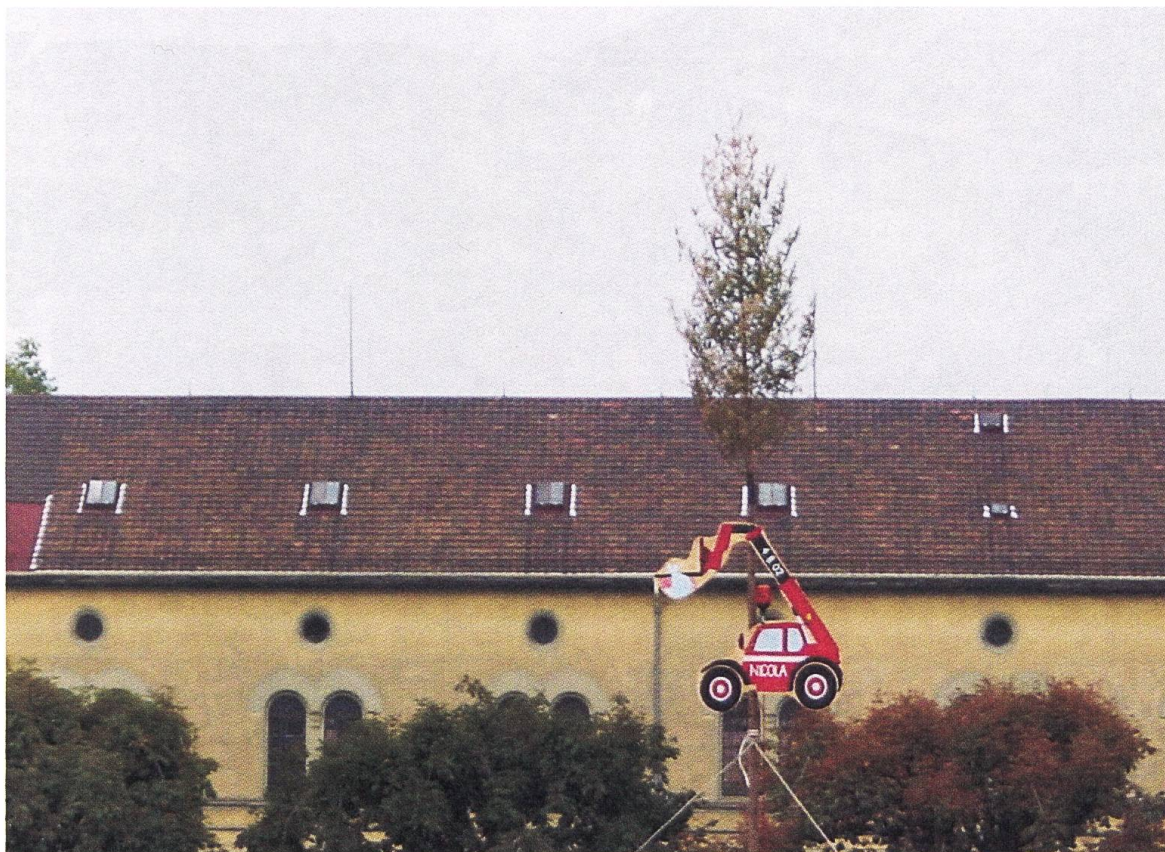
Kasernenareal, September 2002 (J. Stollmann)

dents as a place to live and has generated a lively cultural and pub scene.