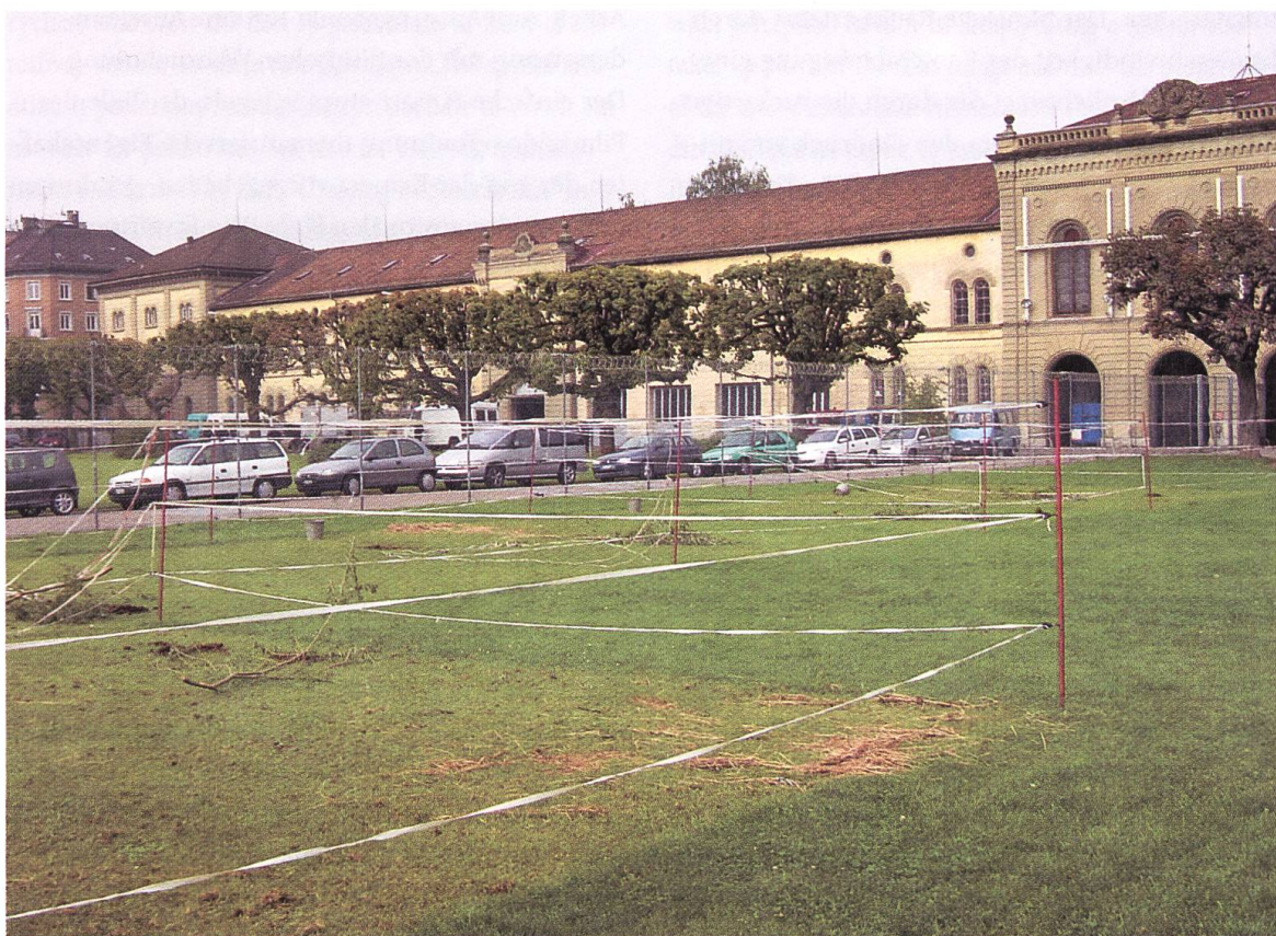
Kasernenareal, September 2002

changed scripts and another group realised them on the same day. Students were free to realise the script in documentary form, that is, by filming the activities of third parties, or in fictional form, that is, by having the group itself act out the activities. It was important to offer the choice between these two options for the subsequent discussion on what is often a thin line between documentation and fiction. The outcome of this first exercise was a series of very short staged projects on the uses of Josefs- wiese and Stadelhofen Square.