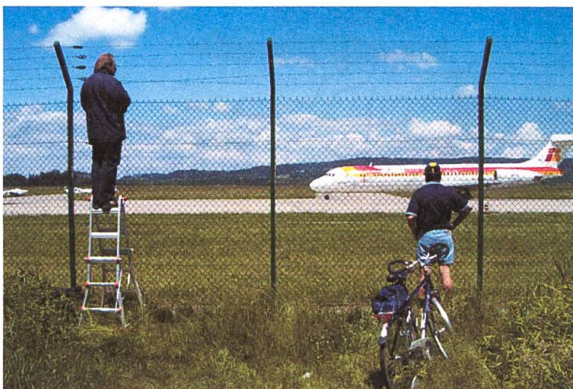
Project by Thomas Knüvener

Leitgedanke dieses Projektes ist das Aussergewöhnliche des Alltags. Der Flughafen ist als öffentliche Einrichtung und besonders im Rahmen der aktuellen Diskussionen um den Fluglärm von grossem öffentlichem Interesse. Darüber hinaus zieht der offene Flughafenraum die Leute an: Spaziergänger, Jogger, Reiter, Skater und Planespotter bewegen sich fast zu jeder Tageszeit zuhauf um den Flughafen. Das Projekt Open Closure liest den Sicherheitszaun deshalb weniger als Grenze sondern viel mehr als Verbindungsglied zwischen zwei unterschiedlichen Welten. Ein Netz aus Wegen, Pfaden und temporären Spuren umspannt den Flughafen als Grüngürtel der ständigen Bewegung. Der Flughafenbetrieb soll dabei in seiner Komplexität erfahren werden können mit Starten und Landen, Wasserturm, Feuerwehranlage, Enteisung und Befahrung. Das Territorium des Gürtels ist als Wald und offene Allmend per Gesetz allen zugänglich und soll als fragmentierte Bühne für die verschiedensten formellen und informellen Nutzungen wirken. Am Südende der Piste 16/34 definieren rasch wachsende Pflanzen die Räumlichkeit einer zukünftig möglichen Bebauung nach den Regeln der Sicherheitszonenbestimmungen. Im Norden wird über die Art des Unterhalts mit Landmaschinen ein neuer Parktyp aus ehemaligen Landwirtschaftsflächen entwickelt.