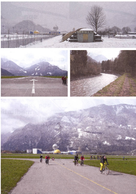
Ortsbesichtigung Interlaken April 2006 Interlaken site visit, April 2006

The project generates a responsive and adaptive landscape. It is a design that is constantly evolving and capable of embodying a new identity for the eastern front of Interlaken.