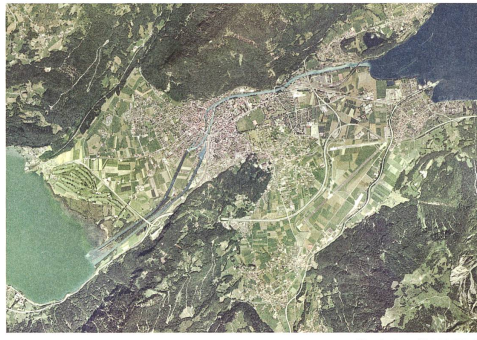
Interlaken Luftbild Interlaken, aerial photograph