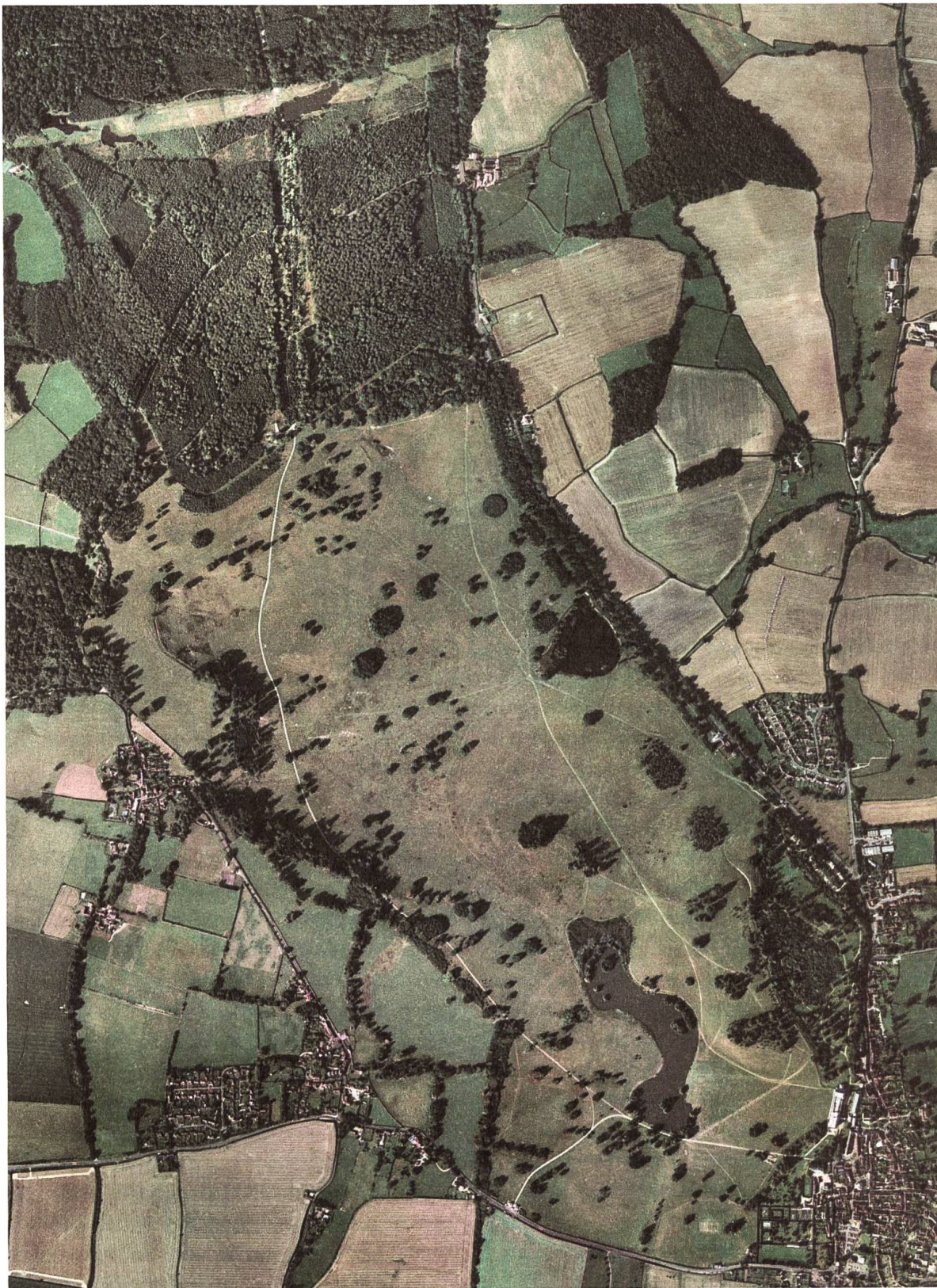
Petworth House and Park, Luftbild