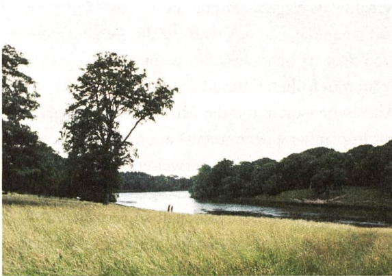
Holkham Hall, Sommer 2005

gung gegen Ende des 18. Jahrhunderts, als William Gilpin (1724–1804), Uvedale Price (1747–1829) und Richard Knight (1750–1824) eine ‹Theorie› des Pittoresken entwarfen. Es ist allerdings schon viel früher eine ‹Tendenz zur Bildhaftigkeit› 18 zu beobachten, bei der die Landschaftsgärtner ihre Anlagen als Serie von ‹Szenen› – eigentlichen ‹Bildern› – anlegten. Dabei kann kaum überraschen, dass bei der fortschreitenden Naturalisierung der Gärten in der ersten Hälfte des 18. Jahrhunderts ein in Italien ausgebildeter Maler, William Kent, zum Protagonisten dieser Entwicklung wurde und die ‹landschaftliche Phase der naturnachahmenden Gartenkunst› einleitete. 19 Doch bereits seine Entwürfe, etwa für die riesigen Anwesen von Stowe (ca. 1710–1750) und Holkham Hall (ca. 1730–1760), sprengten die auf das ‹Bildformat› begrenzte Räumlichkeit dieser Tendenz, indem Kent die einzelnen, im Vergleich untereinander durchaus noch verschiedenartigen ‹Szenen› – ein-