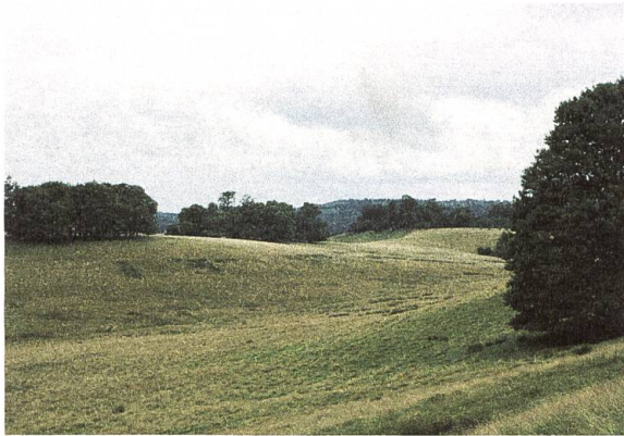
Petworth Park, Sommer 2005