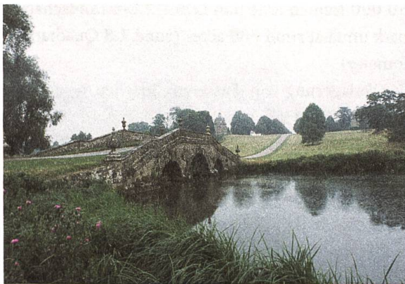
Stowe Landscape Gardens, Sommer 2005

Neben praktisch-politischen standen vor allem poetisch-ästhetische Motive. 10 David Watkin vertritt sogar die Meinung, dass die politisch-moralische Interpretation eher rhetorischer Art sei und schiebt in seiner Argumentation die Sehnsuchtsmomente nach einer klassisch-idealen Landschaft in den Vordergrund, deren Vorstellungsmoment sich aus der Lektüre antiker Literatur 11 und der aufkommenden Grand Tour in die «antike Welt» nähre: «More important [...] was the romantic desire to create an Elysium or heaven on earth, a kind of pagan Garden of Eden, and it was encouraged by a reading of classical literature.» 12 Dieser Einschätzung entsprechen die frühen Beispiele von Chiswick oder Stowe durchaus. Hier wurde mit dem Bau antikisierender Gartenarchitekturen und Skulpturen das klassische Bildungsprogramm ihrer Bauherren ausgebreitet, das in seiner Symbolik auf eine freiheitliche, arkadische Welt verweist. Natur und Landschaft bildeten für solche Pro-