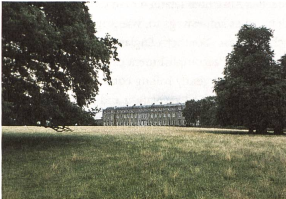
Petworth House, Sommer 2005

ten. Price ging in seinen theoretischen Überlegungen wohl immer von einer «szenisch» begrenzten, bildhaften Vorstellung von Natur aus, die trotz grosser Varietät und Komplexität eine ansprechende, eben malerische Einheit darstellt. In der Praxis dagegen, wo die Anlagen unter Kent und Brown immer grösser wurden, bis sie sich schliesslich ganz in der englischen Landschaft aufzulösen schienen, war eine solche «malerische Einheit» in der Komplexität der Naturform nur durch eine radikale Reduktion und Abstraktion der Mittel – wie sie Brown entwickelte – erfolgreich umsetzbar. Wenn also Price schreibt, bei Brown würde alles «distinct» und «unconnected» bleiben, erkennt er zwar die Problematik, als Kritik ist es aber kaum mehr als eine Polemik.