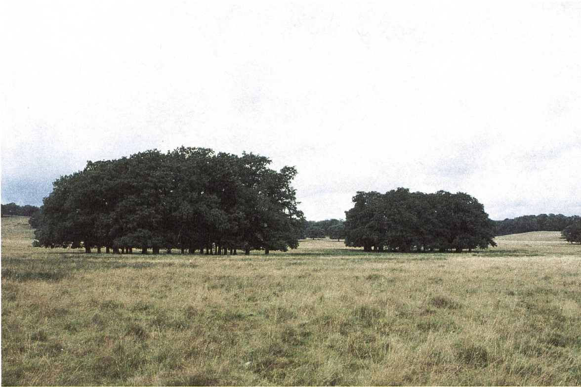
Petworth Park, Clumps, Sommer 2005

aber dennoch durch eine unerklärliche Selbstverständlichkeit. Darin manifestiert sich die synthetische Kraft pittoresker Komposition ebenso wie in der Einbindung neo-palladianischer Villenarchitektur in die ‹freie› Landschaft. Scheinbar paradoxerweise ermöglicht auch bei dieser Architektur gerade die Geometrisierung und auf Fernwirkung ausgelegte Reduktion von Volumenkomposition und Ornament erst eine solche Integration. 55 Browns Verwendung der Natur als ‹Material› seiner Entwürfe bringt nochmals Whately knapp auf den Punkt: ‹Nature, always simple, employs but four materials in the composition of her scenes, ground, wood, water and rocks. The cultivation of nature has introduced a fifth species, the buildings requisite for the accommodation of men. [...] Every landscape is composed of these parts only; every beauty in a landscape depends on the application of their several varieties.› 56 Tatsächlich scheinen die aufgezählten Elemente Brown auszureichen: Die vorgefundene Topografie transformiert er in mime-