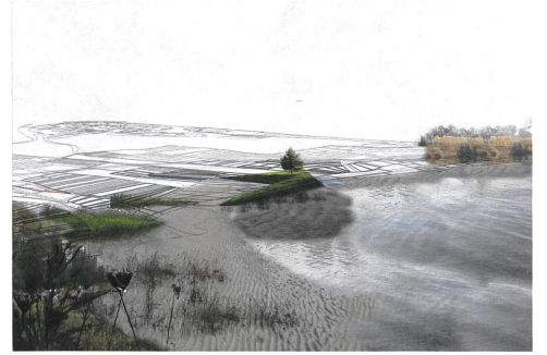
perspective of shoreline

The Sub-Rhine Delta will be able to solve the existing problems of disconnection and programmatic cohesion by linking existing open space uses and activities in a dynamically manifested landscape.