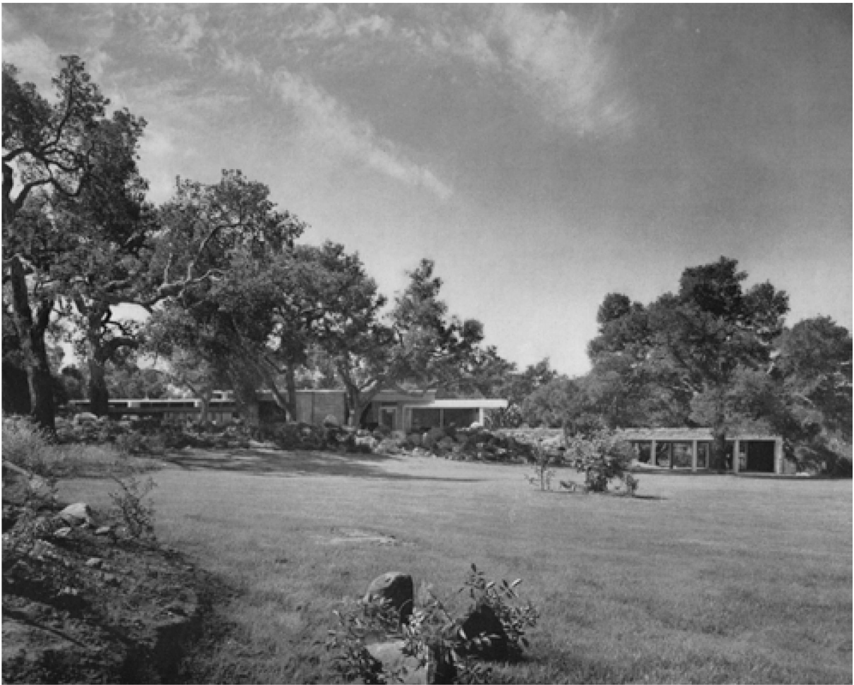
Teil der Kulturlandschaft des Oak Woodland, Haus Tremain von Norden, um 1949