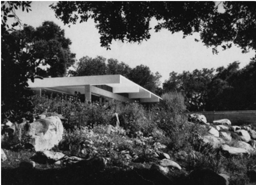
Blick aus dem Elternschlafzimmer des Hauses Tremain, Kalifornien, 1948 Gärtnerische Staudenwildnis im Bereich der Terrasse, um 1949