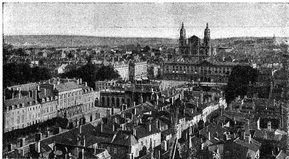
Vue générale de Nancy.

rieur est relié au télégraphe et met la ferme en communication avec les principaux marchés du monde.