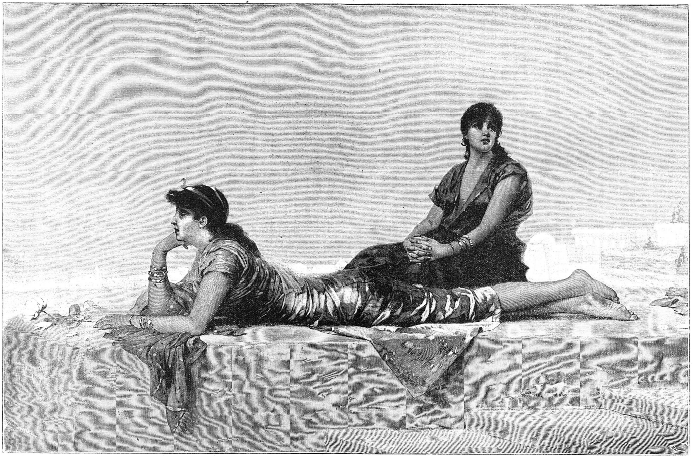
Les Sphinx vivants