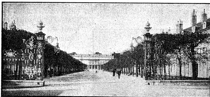
Nancy: Place de la Carrière.

celle d'une banque et, au bureau directorial, un téléphone indépendant de celui affecté au service inté-