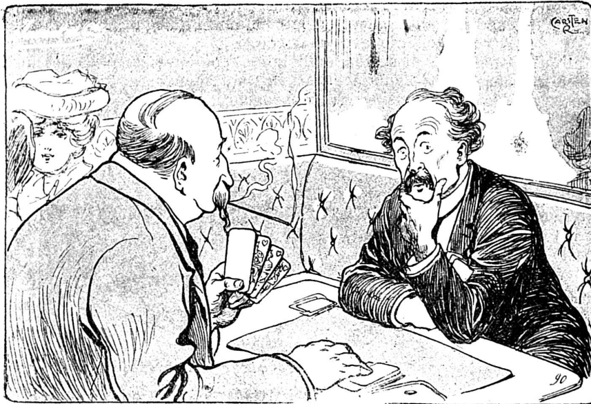
LE JOUEUR DE PIQUET. — Ma quatrième est majeure. L'AGENT MATRIMONIAL ( distrail ). — Il serait temps de la marier ; quelle dot lui donnez-vous ?