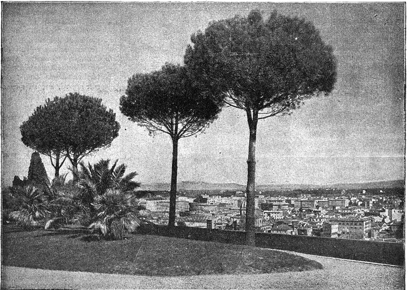
La Ville de Rome, vue du Janicule.

ment se fait-il que vous l'avez trouvée? Pour venir au Maset, il faut y avoir perdu quelque chose, ou y attendre quelqu'un. Or, comme je ne connais que Bamboche qui puisse y donner des rendez-vous, il faut donc que vous soyez venue ici pour dérober mon bijou, ou pour m'enlever le cœur du gardian, dit-elle, en s'animant à sa propre colère.