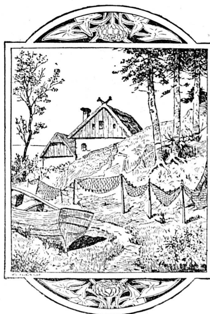
Où est le pêcheur ?