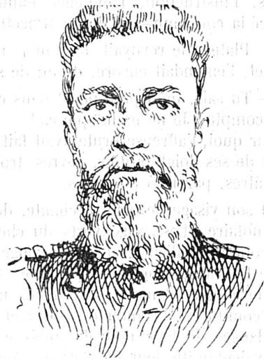
Contre-amiral russe Virenius

commandant de l'escadre russe de la mer du Nord. Il avait pour mission, à l'ouverture des hostilités russo-japonaises de se joindre à l'escadre russe de Port-Arthur. Il reçut cependant l'ordre de stationner dans les eaux méditerranéennes jusqu'à l'arrivée de la flotte de la Baltique.