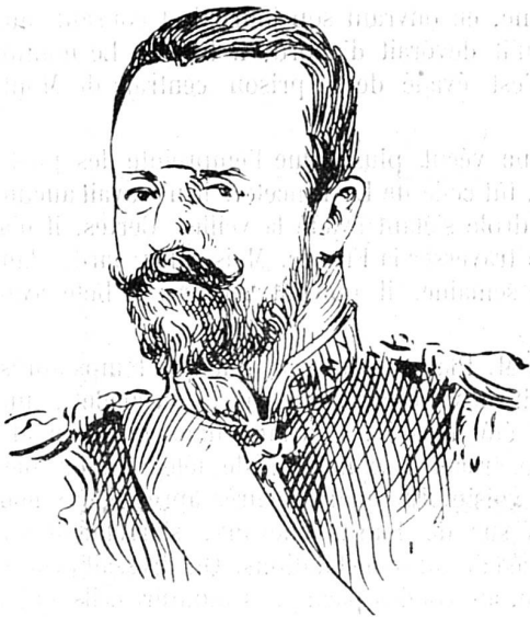
Amiral russe Skrydloff

gouverneur en Extrême-Orient, né en 1843, depuis 1903 à Port-Arthur. Ses capacités remarquables le firent nommer au poste de commandant de l'escadre russe du Pacifique lors des troubles de Chine (soulèvement des Boxers). En 1867 il prit le commandement de la mer d'Égée. De 1875 à 1876 il accompagna le grand-duc impérial Alexandrowitch durant son voyage en Orient. De 1883 à 1893 il fut attaché de la légation russe à Paris.