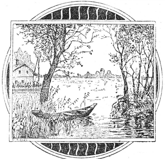
Cherchez les pêcheurs !