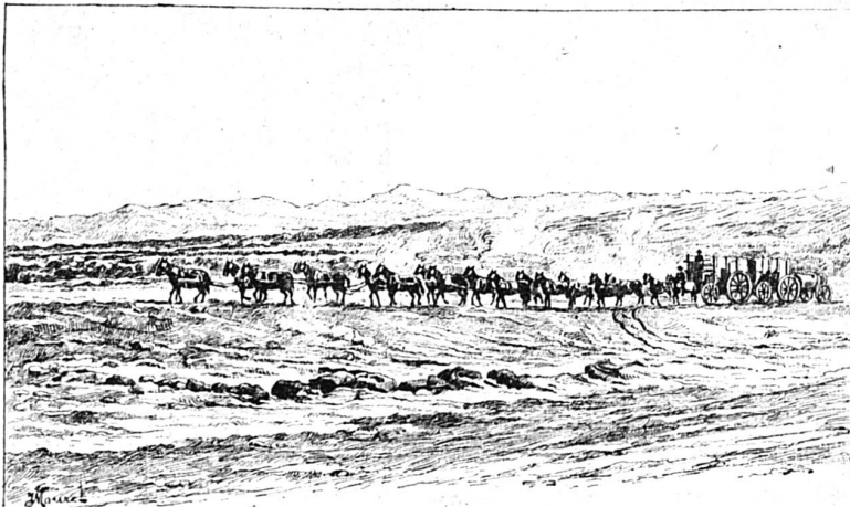
La traversée de la Vallée de la mort

En été, le thermomètre y atteint 63° centigrades à l'ombre, et descend rarement, la nuit, plus bas que 40. Il va sans dire que rien ne vit dans un tel enfer. Les animaux sauvages s'en écartent avec effroi, l'oiseau même l'évite dans son vol. Pendant longtemps, et bien que la Vallée de la mort fût réputée contenir certaines richesses minérales, il ne se rencontra aucun pionnier assez aventureux pour franchir le seuil de ce