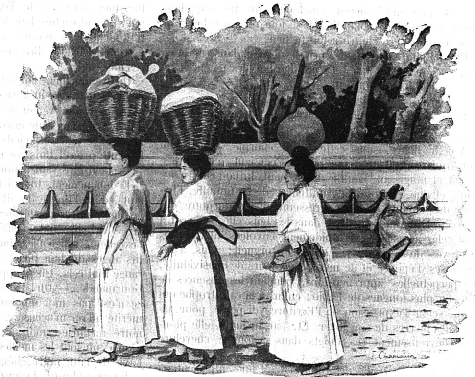
Aragon. Retour du lavoir

En attendant l'heure, je fis un détour pour visiter les bains arabes, qui n'ont rien d'extraordinaire, mais qui sont admirablement conservés, et pour contempler le patio de la maison Sureda, qui est le plus vaste et le plus beau