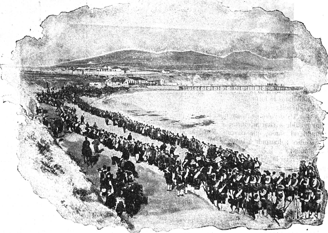
Un convoi japonais

Les officiers sont en général capables, beaucoup d'entre eux ont fait leur éducation en Europe et mettent au profit de leur pays les tactiques qu'ils ont rapportées de nos écoles militaires renommées.