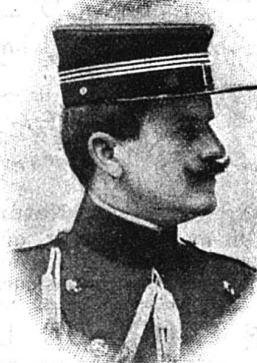
LE COLONEL AUDÉOUD de Genève