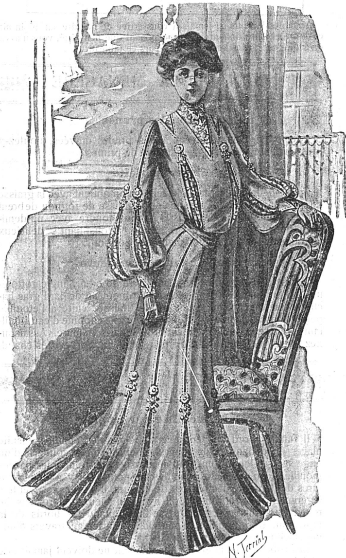
TOILETTE DE RÉCEPTION

En drap. Jupe plate à tranches piquées sur des liserés de taffetas rouge rubis très foncé. Le bas de la jupe en soufflets de taffetas plissé. Motifs de passementerie sur chaque soufflet. Corsage blouse s'attachant par derrière, avec crevés de guipure grise.