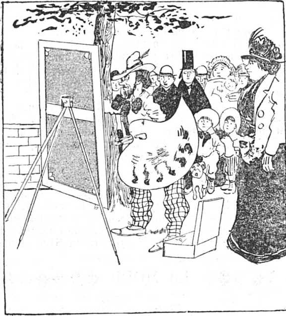
Aimables lecteurs, si jamais il vous arrive de peindre en plein air et d'être entouré d'un monde aussi gênant que peu gêné, vous n'avez qu'à dire ceci : Mesdames et Messieurs ce tableau.....