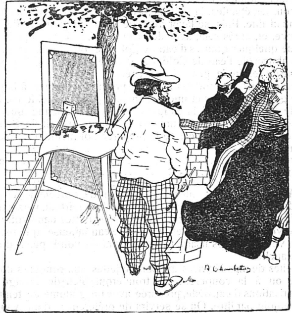
.....est à vendre..... y aurait-il amateur ? Et alors vous verrez l'effet produit.... c'est immédiat et ne rate jamais.