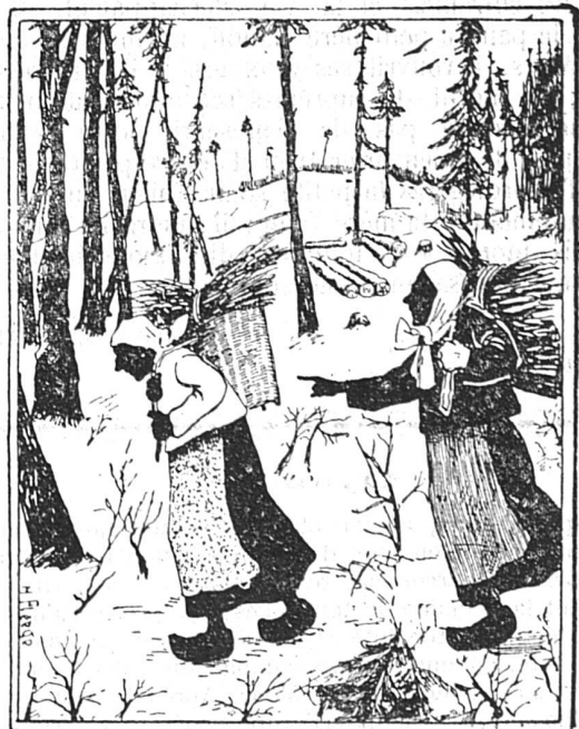
Cherchez les deux gardes forestiers.