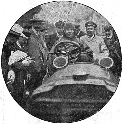
Le vainqueur Théry sur sa voiture Richard-Brazier

La Coupe est revenue en France par la victoire de l'un de ses champions, Théry, sur sa voiture Richard-Brazier.