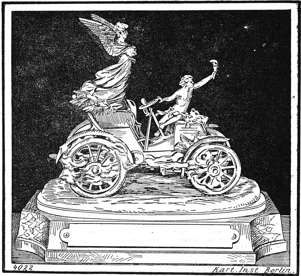
■ La Coupe Gordon Bennet

Les nations belge, italienne, anglaise étaient représentées et leurs voitures ont sérieusement figuré dans la course. L'Amérique seule, où pourtant l'industrie mécanique est si florissante, n'a point pris part à l'épreuve, les voitures qu'elle aurait voulu mettre en ligne n'ayant pu atteindre une vitesse suffisante.