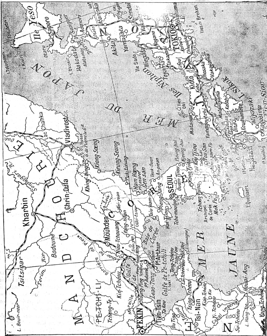
Carte du Japon, de la Corée et de la Mandchourie

Nous donnons aujourd'hui la carte non-seulement de Corée et de Mandchourie, où se déroulent actuellement les graves événements de la guerre russo-japonaise, mais aussi celle de l'archipel nippon. On n'ignore pas que l'escadre de la Baltique arrivera bientôt en Extrême-Orient où, de concert sans doute avec la flotte de Vladivostok, elle accomplira de nombreux raids dans la mer du Japon et sur les côtes orientales de l'empire du Mikado. — A l'heure où nous écrivons ces lignes, l'escadre de Port-Arthur est dispersée dans les ports chinois et presque anéantie. On s'attend à chaque instant à la chute de la forteresse qui tombera certainement au pouvoir des Japonais.