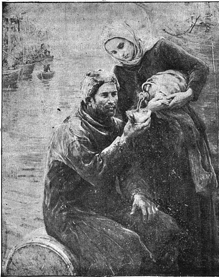
Demont-Breton. — Départ pour l'Islande : La dernière goutte de lait

Que pouvait faire une poignée d'hommes contre les renforts qui arrivaient de l'Est ?