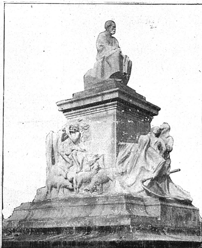
Le Monument de Pasteur

Au sommet se dresse la statue. Pasteur est représenté assis, les yeux fixés vers l'horizon, bien au-delà duquel semble errer sa pensée, son génie cherchant dans le domaine de l'infini quelque découverte utile à ses semblables. L'expression du visage est fort belle: il y a à la fois du Socrate et de l'Homère dans ces traits inspirés. Mais quel dommage qu'on n'ait pas donné de plus fortes proportions à cette