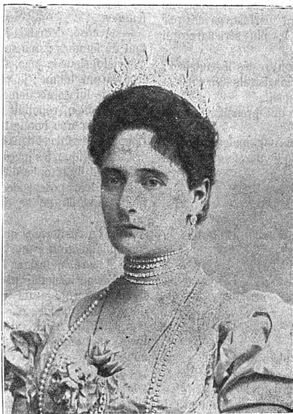
L'impératrice Alexandra de Russie

Le peuple russe, au milieu des terribles moments qu'il traverse, a eu, en août dernier, la grande joie d'apprendre que l'impératrice Alexandra Feodorowna venait de donner naissance à un grand-duc. Ce fut le jeudi 25 août qu'eut lieu, dans la chapelle impériale de Peterhof, le baptême de l'héritier présomptif de l'empire russe, au milieu d'une pompe inaccoutumée. Pendant la cérémonie, Nicolas II créa son fils, Nicolas Nicolaïevitch, chevalier de Saint-André-Newsky, chevalier de l'Aigle-Blanc, grand-croix de Sainte-Anne, etc., titres accompagnés encore d'autres dignités dont l'énumération serait trop longue. Les vœux du tsar et du peuple russe sont comblés. Les mauvais prophètes avaient, à maintes reprises, prédit au tsar qu'il n'aurait pas d'héritier direct. Cette prophétie semblait devoir se réaliser, car, depuis le 14 novembre 1894, jour du mariage de Nicolas II avec la princesse Alexis de Hesse et du Rhin, l'impératrice n'avait